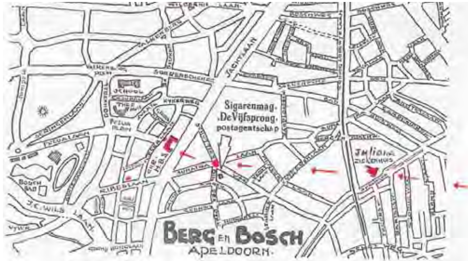
Kaartje van Berg en Bosch met aanvliegroute van de Firefly vanaf de markt (met oriëntatiepunten in rood).

Toen Christern in duikvlucht op de school kwam aanvliegen dreigde een botsing met de toren van het gebouw.