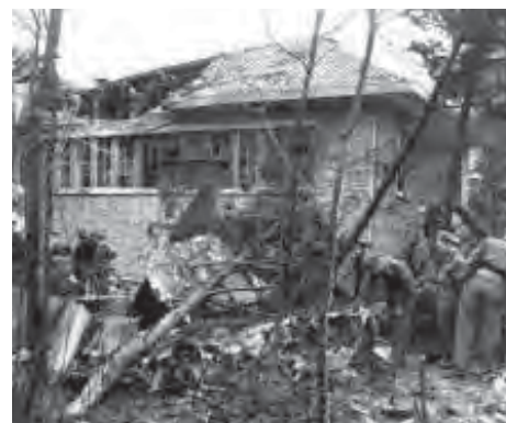
De vernielde gymzaal en de plaats waar het vliegtuig is neergekomen, gezien vanaf de Vliegerlaan.

Op 7 oktober 1946 stortte een militair vliegtuig op het gymnastieklokaal van de Christelijke H.B.S. aan de Jachtlaan in Apeldoorn. Dat lokaal werd bij bepaalde gelegenheden ook gebruikt als gemeenschapsruimte en had als zodanig een symbolische betekenis. De gevolgen waren verschrikkelijk: twee en twintig scholieren en de piloot vonden de dood; zijn moeder overleed door een hartaanval. Anderen raakten zwaar gewond. Het dorp verkeerde in een shock.