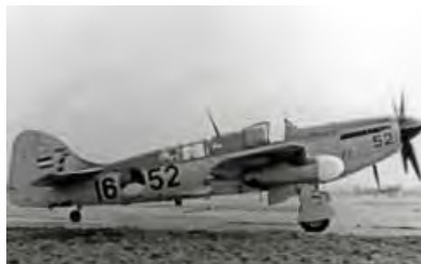
Fairey Firefly op vliegbasis Valkenburg

Dit toestel fungeerde als jager-verkenner en kon opereren vanaf een vliegdekschip. Max was een van de leerling-vliegers. Voor hem en de meesten van zijn collega's was het 'Vuurvliegtuig' tot voor kort onbekend.